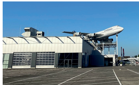
Technik Museum Speyer