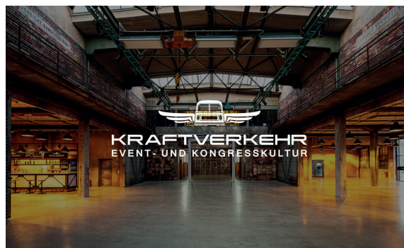
Kraftverkehr Event und Kongresskultur, Chemnitz